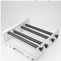
RSS-E 205 płyta bazowa do uchwytów na kolby Erlenmeyera