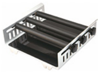
RSS-E 110 uniwersalny stojak z rolkami dociskającymi, regulacja pionowa